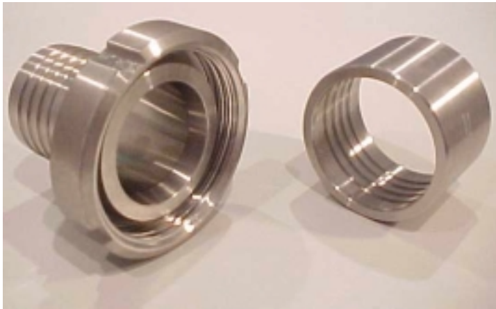
Din hembra con casquillo

Ofrecemos el conjunto DIN y casquillo tanto hembra(con tuerca) como macho.