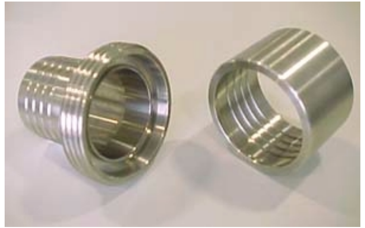
Din macho con casquillo

A continuación adjuntamos las medidas estándar de los racores que podemos suministrar: